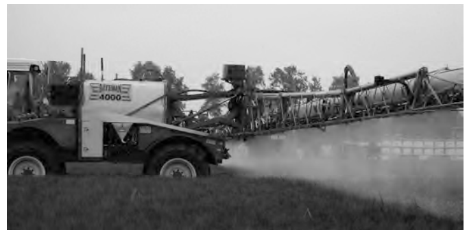
Selbstfahrspritze Bateman 4000 mit aktiver Luftunterstützung

Der Gattungsname Euodia ist aus dem Griechischen entlehnt und bedeutet Duft oder Aroma . Eu = gut, odia = Duft