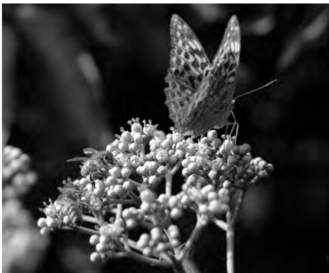
Euodia Honigbaum (Stinkesche) bekommt vielfältigen Besuch

Bei Baumpflanzungen könnten wir Bäume mit Bienentracht bevorzugen, z.B. blüht die Stinkesche bis in den Oktober hinein und bringt in einer trachtarmen Zeit noch Futter für die Bienen.