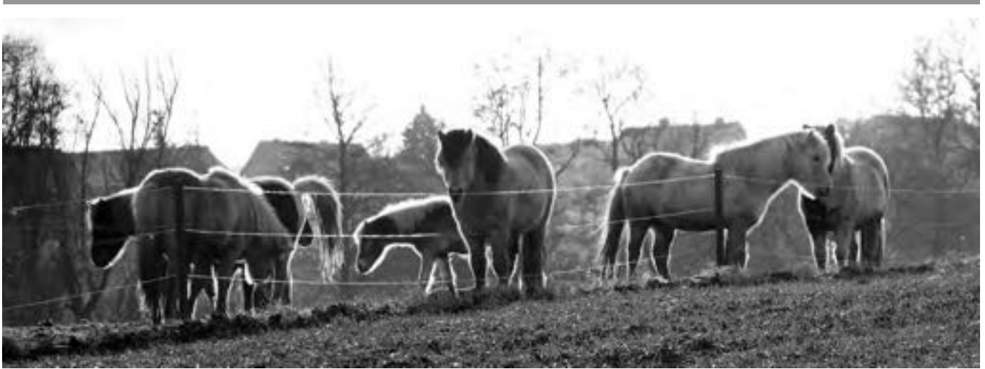
Isländer vor Neu-Buchholz