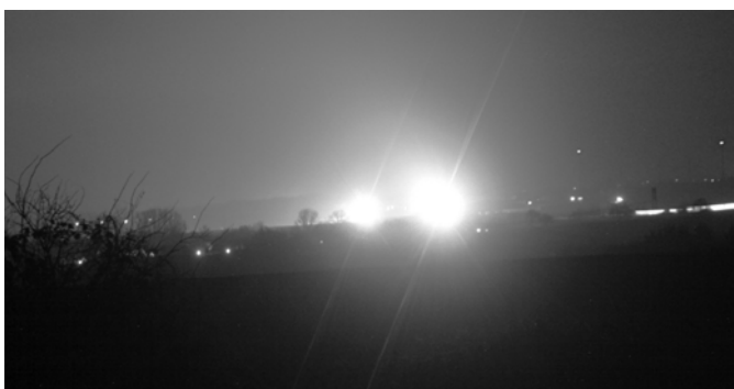
strahlender Lichterglanz über dem Tollensetal