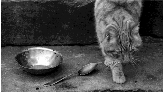
Wer einmal aus dem Blechnapf frisst...