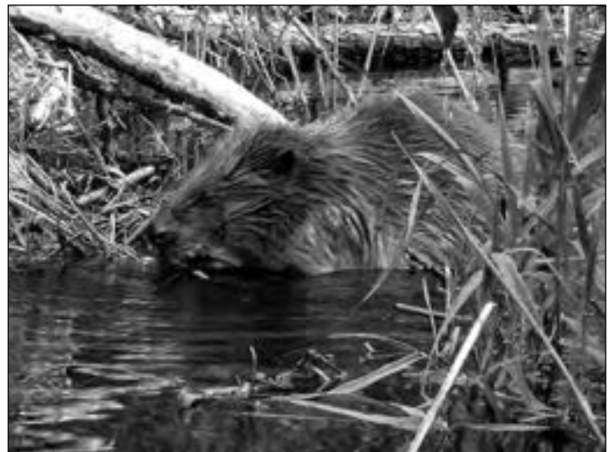
Sommer 2011 Biber bootsnah an der Ostener Brücke