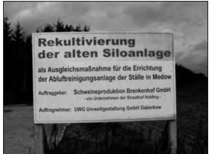
UWG Umweltgestaltung als Auftragnehmer der Straathof Holding