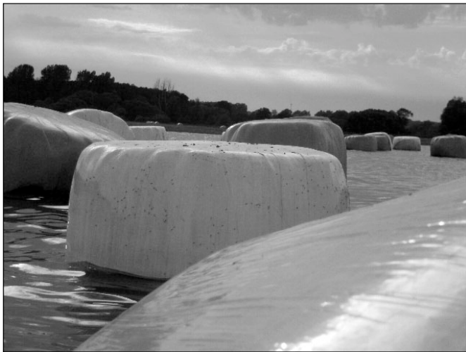
August 2011 Klimawandel!? Grönlandeis im Tollensetal?

Moore bieten nicht nur Lebensraum für Wollgras, Moorbläuling und Knabenkraut. Sie haben über Jahrtausende absterbende Pflanzenteile deponiert und dadurch den CO 2 -Ausstoß reduziert. Die Bedeutung der Moore für den Klimaschutz wird global und auch in Deutschland bisher unterschätzt. Moore bedecken nur 3% der Erde, speichern aber doppelt soviel Kohlenstoff wie alle Wälder unserer Erde.