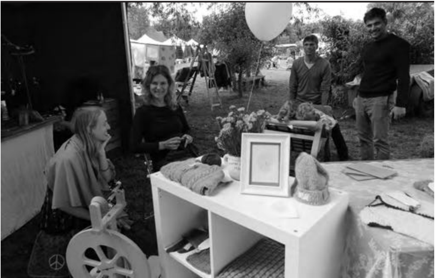
Zum ersten Mal auf diesem Markt dabei zu sein macht mich sehr froh, denn es ist trotz vieler Menschen und seiner Entspannung einzigartig. Schon jetzt kann ich sagen, mich auf nächstes Jahr zu freuen.