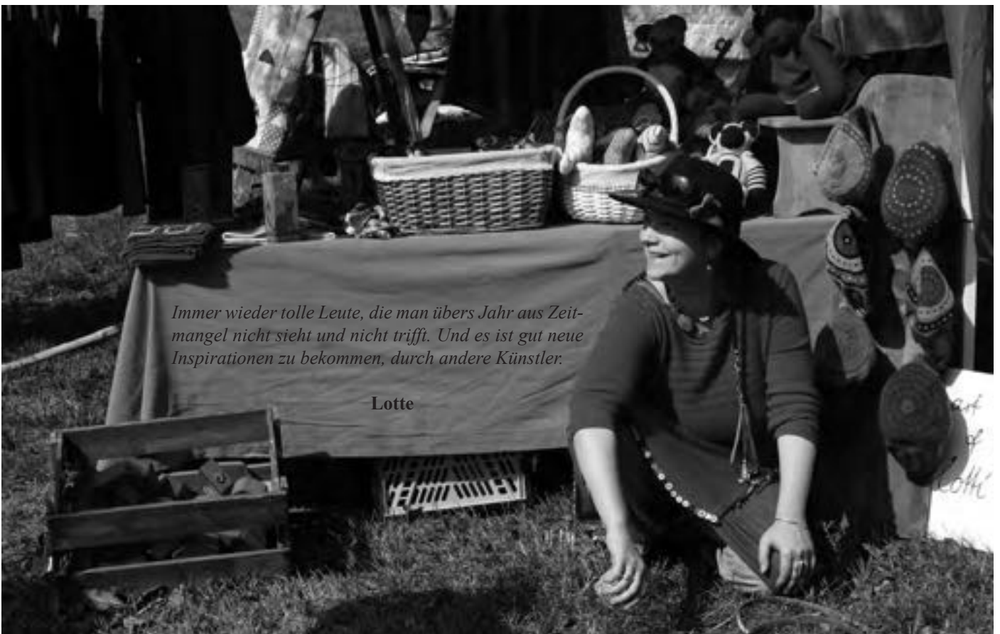
Immer wieder tolle Leute, die man übers Jahr aus Zeitmangel nicht sieht und nicht trifft. Und es ist gut neue Inspirationen zu bekommen, durch andere Künstler.