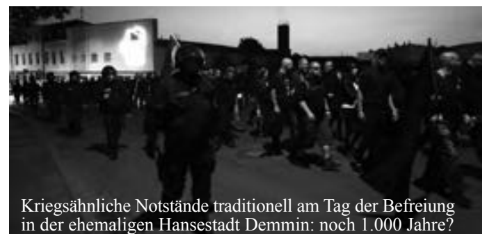
Kriegsähnliche Notstände traditionell am Tag der Befreiung in der ehemaligen Hansestadt Demmin: noch 1.000 Jahre?

Neuigkeiten aus Mecklenburg-Vorpommern, z.B. Heimatpflege: