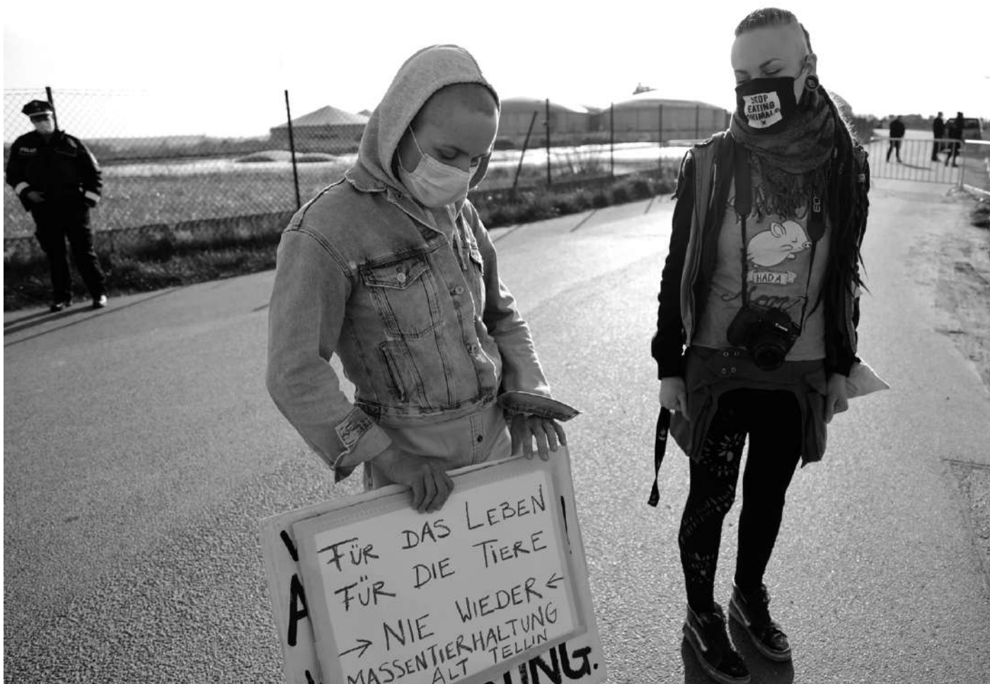
Die Mahnwache geht weiter - Gemeinsam ein Zeichen gegen Massentierhaltung in Alt Tellin und überall, Montag 19.4.2021