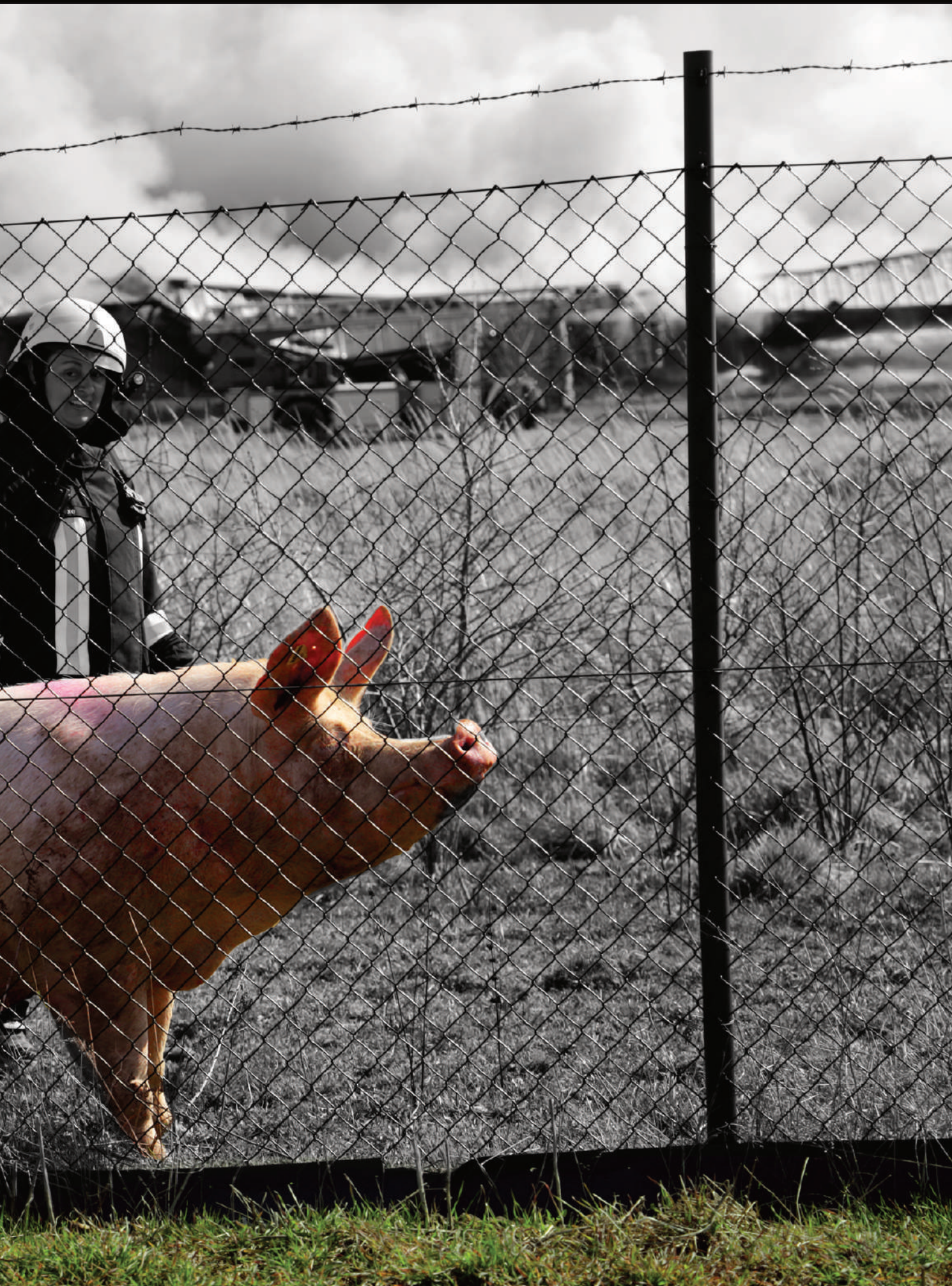
den Namen „Else“ bekommen (zehntausende andere Nummern wurden inzwischen mit schwerer Bergetechnik entsorgt)