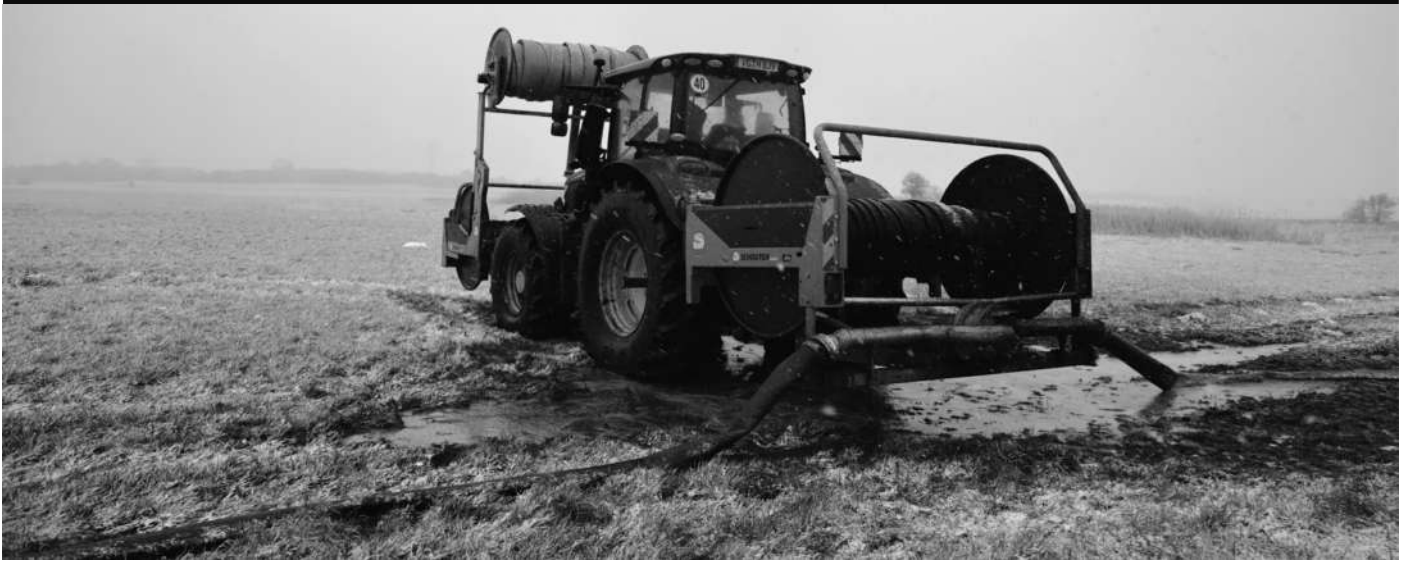
Gülleausbringung am 5. April 2021 mittels Rohrleitung ins Tollensetal