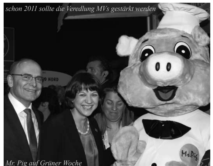
Mr. Pig auf Grüner Woche