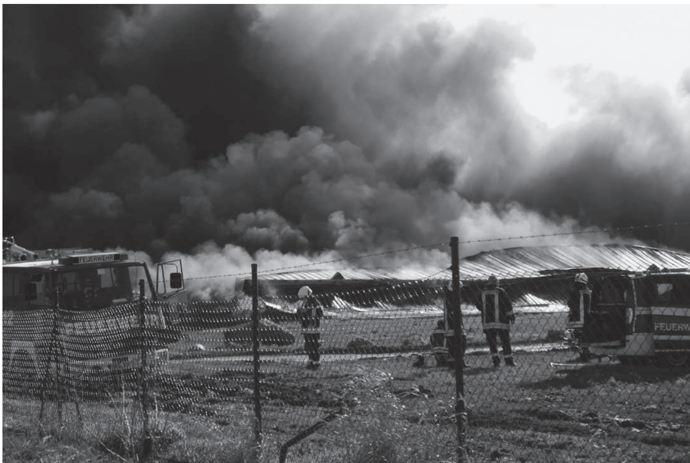
Feuerwehren und Rettungskräfte aus der gesamten Region konnten die Tiere nicht retten