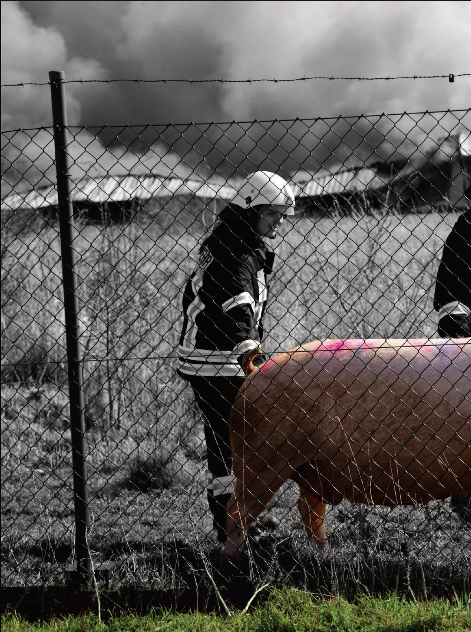
Aus Nummer 38.958 wurde am 30. März 2021 ein wirkliches Glücksschwein - von den Frauen der FFW Alt Tellin hat es