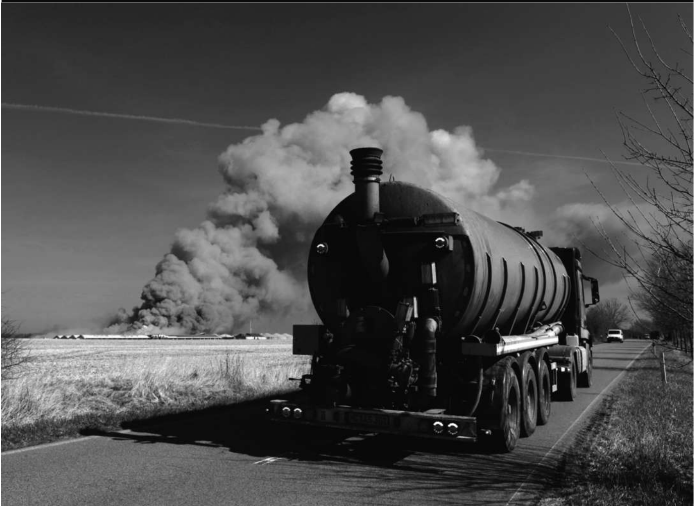
... selbst wenn der Brand nicht mehr zu löschen ist - die produzierte Gülle muss entsorgt werden