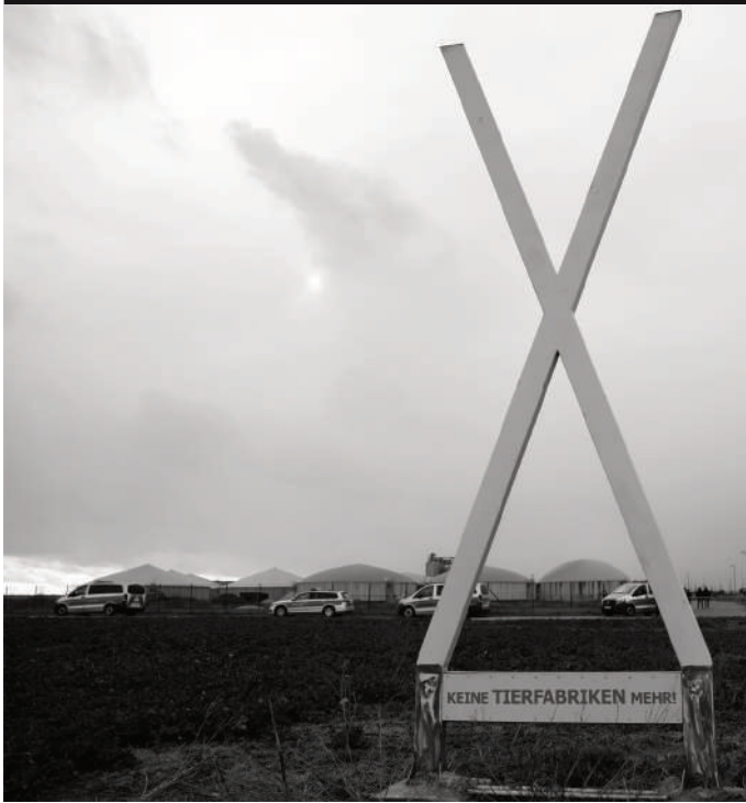
Mahnwache geht weiter - erster Montag danach: 5. April 2021