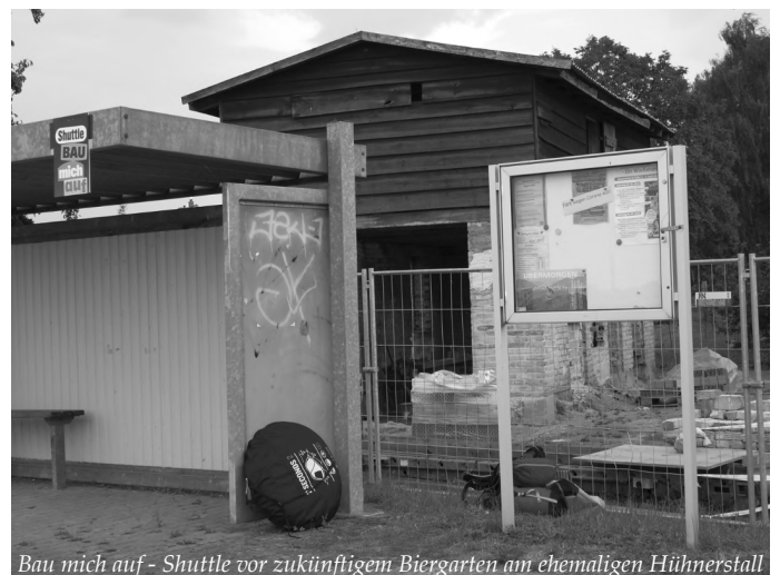
Bau mich auf - Shuttle vor zukünftigem Biergarten am ehemaligen Hühnerstall

Appelplatz hinterm Schloß Hohen Brünzow Donnerstag, 25. August 2022 17:00 Uhr Hohenbrünzow 39 • 17111 Hohenmocker