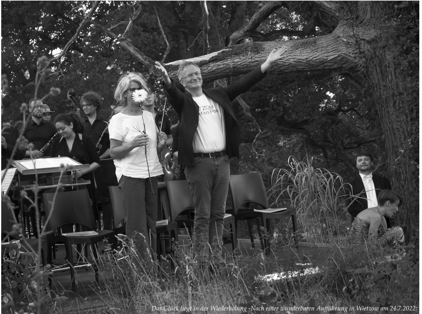
Das Glück liegt in der Wiederholung -Nach einer wunderbaren Aufführung in Wietzow am 24.7.2022: