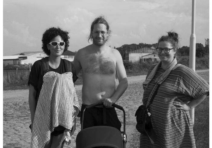
Klimawandel in Broock: Bau Mich Auf zum Ende der Hitzewelle