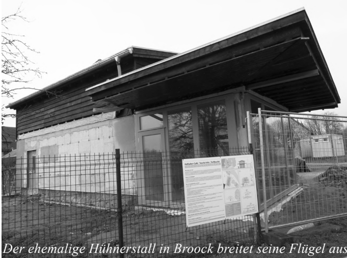
Der ehemalige Hühnerstall in Broock breitet seine Flügel aus