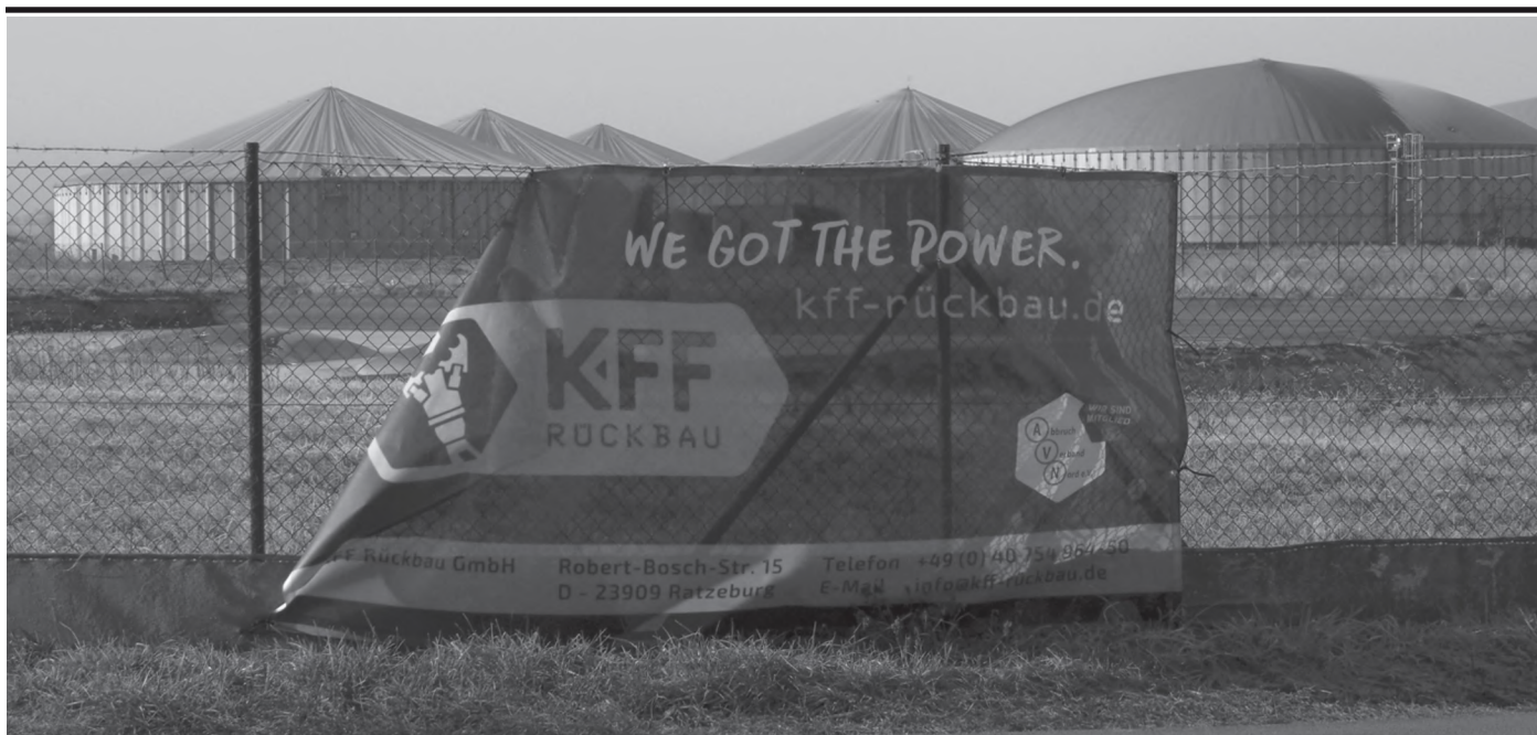
ein Rückbau der Biogas-Anlage ist uns nicht bekannt, aber eine Umrüstung von Schweinegülle auf Rinderfestmist ist geplant