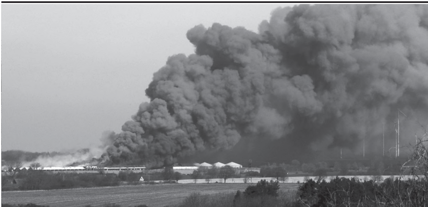
vor zwei Jahren in MV: am 30. März verbrannten ca. 50.000 gepflegte Tiere mit Europas modernster Schweinefabrik am Tollensetal