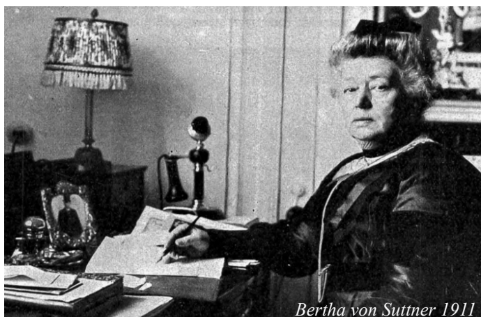
Bertha von Suttner 1911