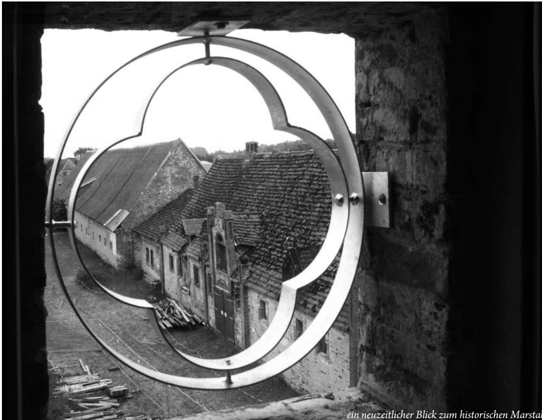
ein neuzeitlicher Blick zum historischen Marstall

Ob der im Antrag benannte „überregional wirkende Kultur- und Tagungsort 2025/26 mit über 60 neuen Ganzjahres-Arbeitsplätzen“ dann „den Betrieb aufnehmen wird“ steht in den Sternen. Doch ein Astropfad zum „Kulturgut Sternenhimmel“ des Sinnes-Parcour am und im Schlosspark muss realisiert sein, damit das Geld fließt.