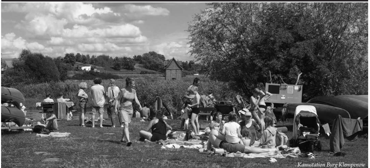
Kanustation Burg Klempenow