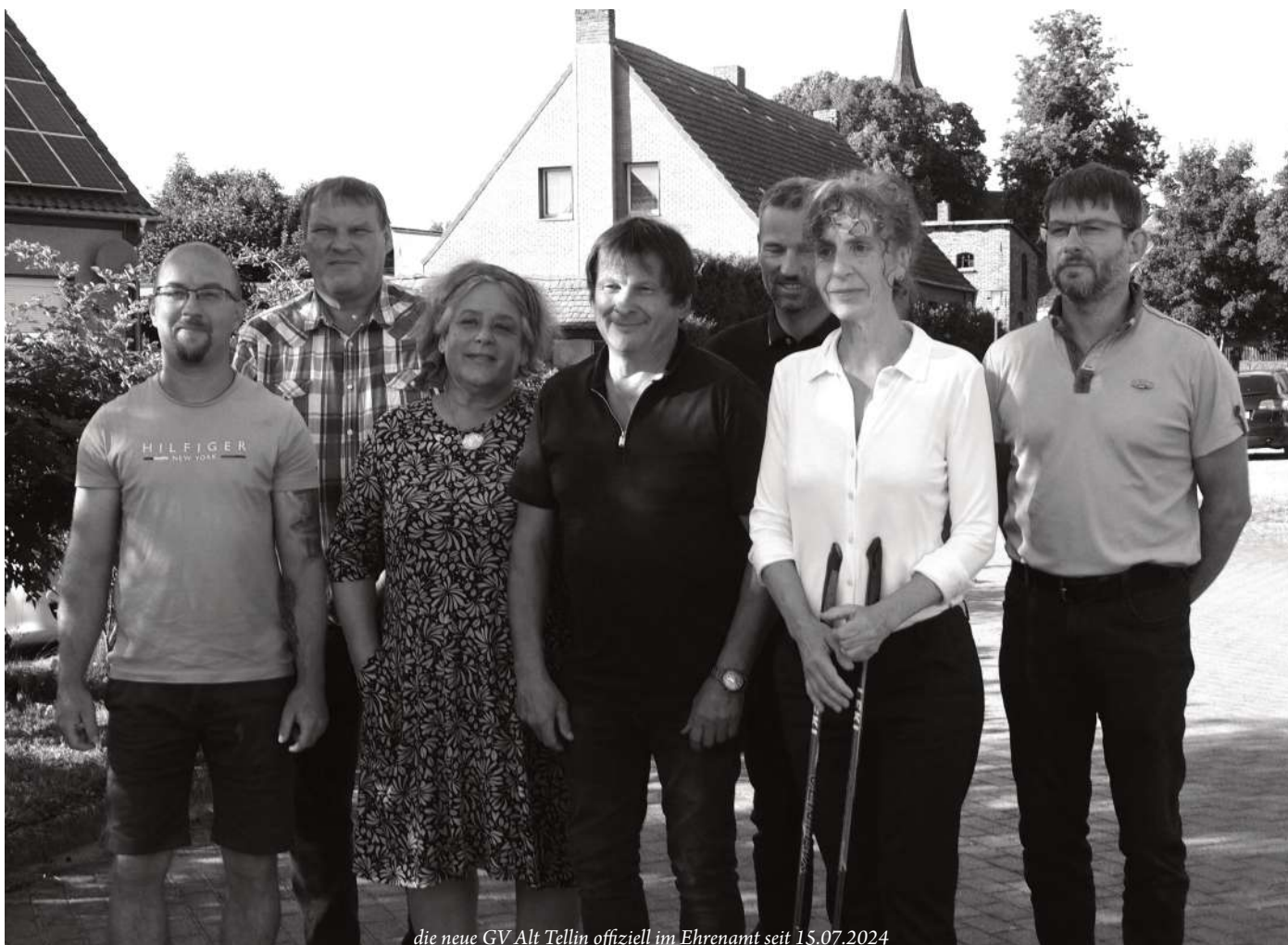
die neue GV Alt Tellin offiziell im Ehrenamt seit 15.07.2024